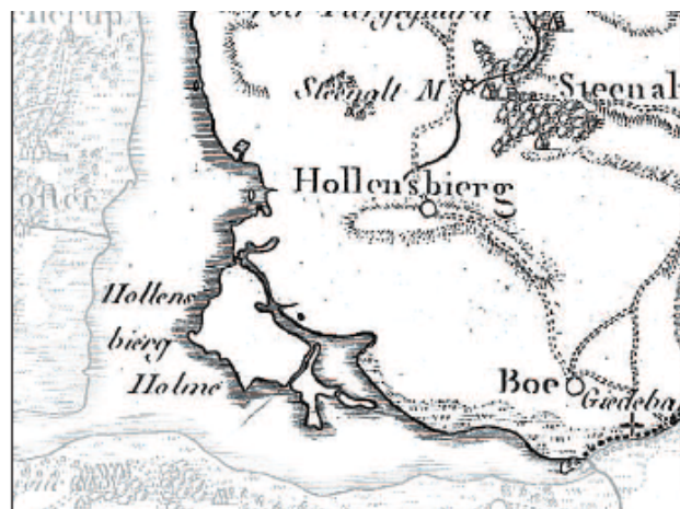
Videnskabernes Selskabs kort fra 1789.

På Videnskabernes Selskabs kort fra 1789 ser man, hvorfor området hedder Hollandsbjerg Holme, idet den sydvestlige del af området da